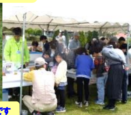
子どもと 会話しながらの 紙すき指導です