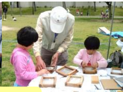
「ケナフの会」会員の「熱心で、丁寧な指導」の様子! こども達も 指導に応え「一生懸命」でした!