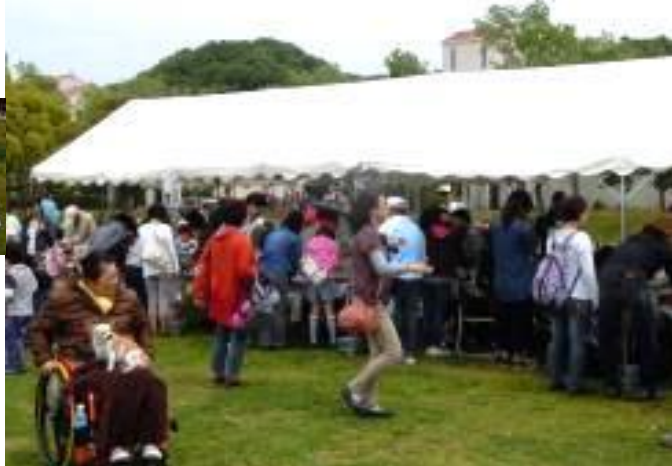
続々と「紙すき」参加者が来場しました 紙すき参加者:157名 でした