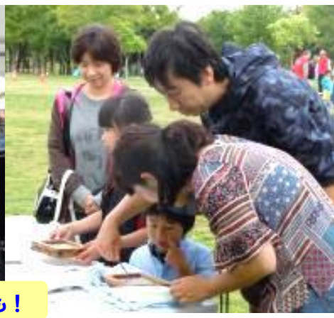
子どもだけでなく父兄も真剣！ 思わず手を出すママも！