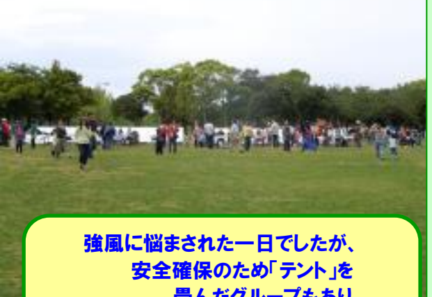
強風に悩まされた一日でしたが、 安全確保のため「テント」を 畳んだグループもあり、 この場所は「風の通り道」の様でした。