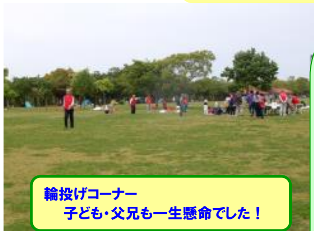
輪投げコーナー 子ども・父兄も一生懸命でした！